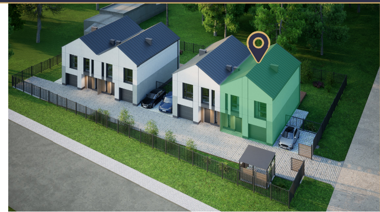
Widok z lotu ptaka - Apartament 2B zaznaczony na zielono

Energoszczędne rozwiązania Przegrody budynku oraz stolarka okienna i drzwiowa, posiadają korzystniejsze parametry termozolacyjne, niż te które są obecnie wymagane.