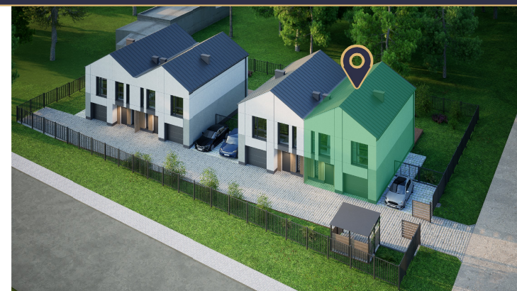
Widok z lotu ptaka - Apartament 2B zaznaczony na zielono