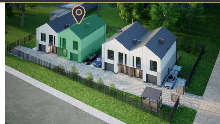
Widok z lotu ptaka - Apartament 2A zaznaczony na zielono