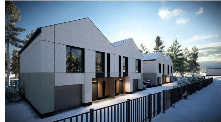
Widok z ulicy - Apartament 2A drugi od lewej