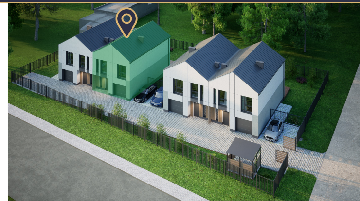
Widok z lotu ptaka - Apartament 2A zaznaczony na zielono

Energoczczędne rozwiązania Przegrody budynku oraz stolarka okienna i drzwiowa, posiadają korzystniejsze parametry termozolacyjne, niż te które są obecnie wymagane.