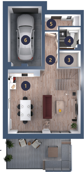
Rzut Parteru Apartamentu 2A