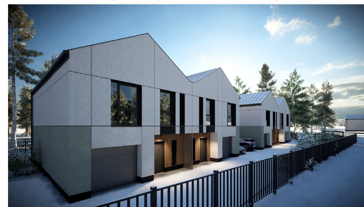
Widok z ulicy - Apartament 2A drugi od lewej