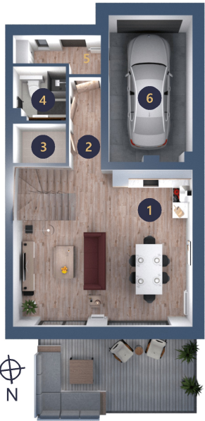
Rzut Parteru Apartamentu 1B