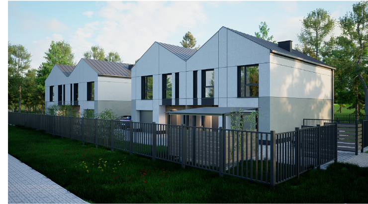
Widok z ulicy - Apartament 1B drugi od prawej