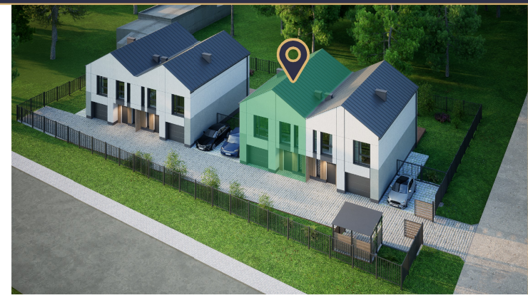
Widok z lotu ptaka - Apartament 1B zaznaczony na zielono

Energoozczędne rozwiązania Przegrody budynku oraz stolarka okienna i drzwiowa, posiadają korzystniejsze parametry termozolacyjne, niż te które są obecnie wymagane.