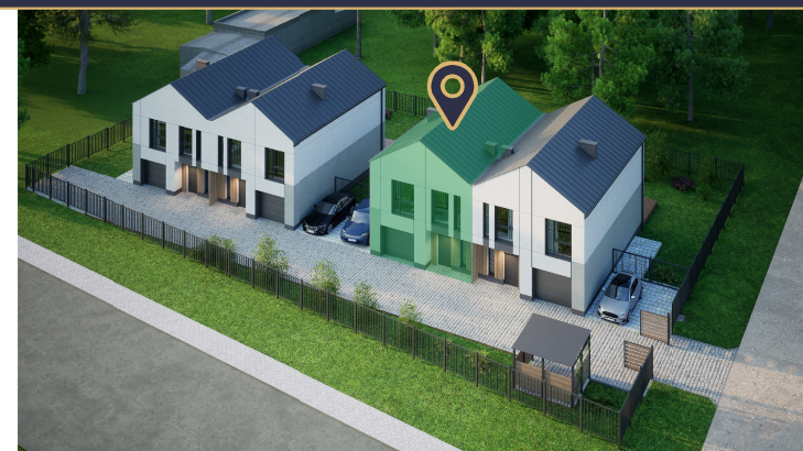
Widok z lotu ptaka - Apartament 1B zaznaczony na zielono